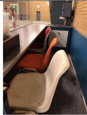
Afspritte stolene i dommerbordet Afsprit til sidst glasset på dommerbordet

Lad venligst være med at "drukne" kontrolpanelet – det er fintfølede elektronik, så alt med måde!!!