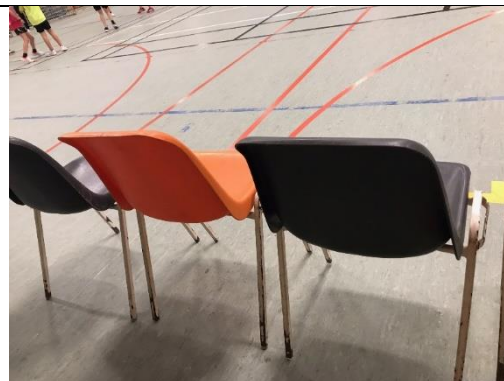
Begge sider – både foran og bagpå