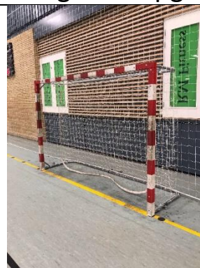
Afspritte målstolper (begge ender)