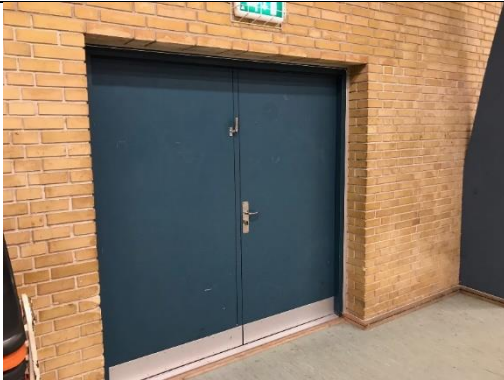
Luk dørene igen og lås gerne dem Husk at afspritte håndtagene